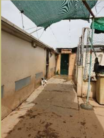
Zugang zu den Katzen