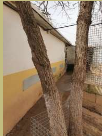
Zugang zu patio 9 Sierra