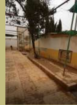
Zugang zu patio 6+7